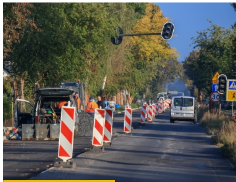
W październiku skończymy przebudowę ul. Głogowskiej za ponad 23 mln zł

Swój finał w tym roku, będą miały również przebudowy ul. Kombatantów, Nowszej i Góreckiego. Dla tej ostatniej termin zakończenia prac zaplanowano na koniec lipca. Projekt o wartości ponad 1,2 mln zł, dofinansowany ze środków Rządowego Funduszu Rozwoju Dróg, obejmuje rozbudowę odcinka o długości 395 metrów. – Mieszkańcy zyskają nie tylko nową, bitumiczną jezdnię o powierzchni prawie 2000 mkw. Powstaną też nowe chodniki