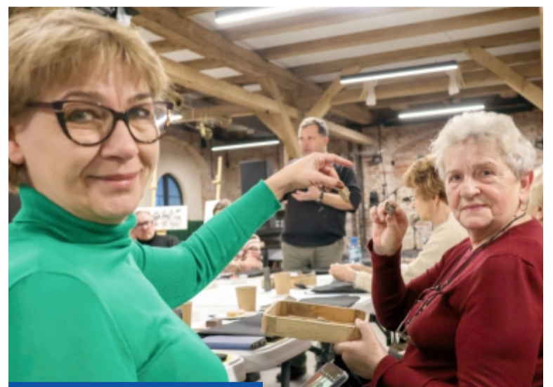
Uczestniczki warsztatów stworzyły własną biżuterię z bursztynu

Praca z bursztynem daje namacalny efekt, poczucie satysfakcji i sprawczości. – To sytuacja, gdzie młody człowiek, który jest zaskompleksiony, zagubiony, wreszcie może poczuć, że coś mu się w życiu udało – podkreślał Rad-