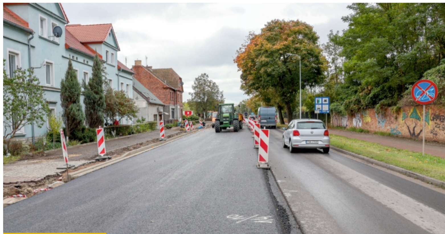
Przebudowa ulic Zielonogórskiej, Chrobrego i Grobli zakończy się w listopadzie

Wymieniamy całą konstrukcję jezdni i wykonujemy nową nawierzchnię. Równocześnie budujemy bezpieczną ścieżkę rowerową, ciągi piesze, zatoki autobusowe