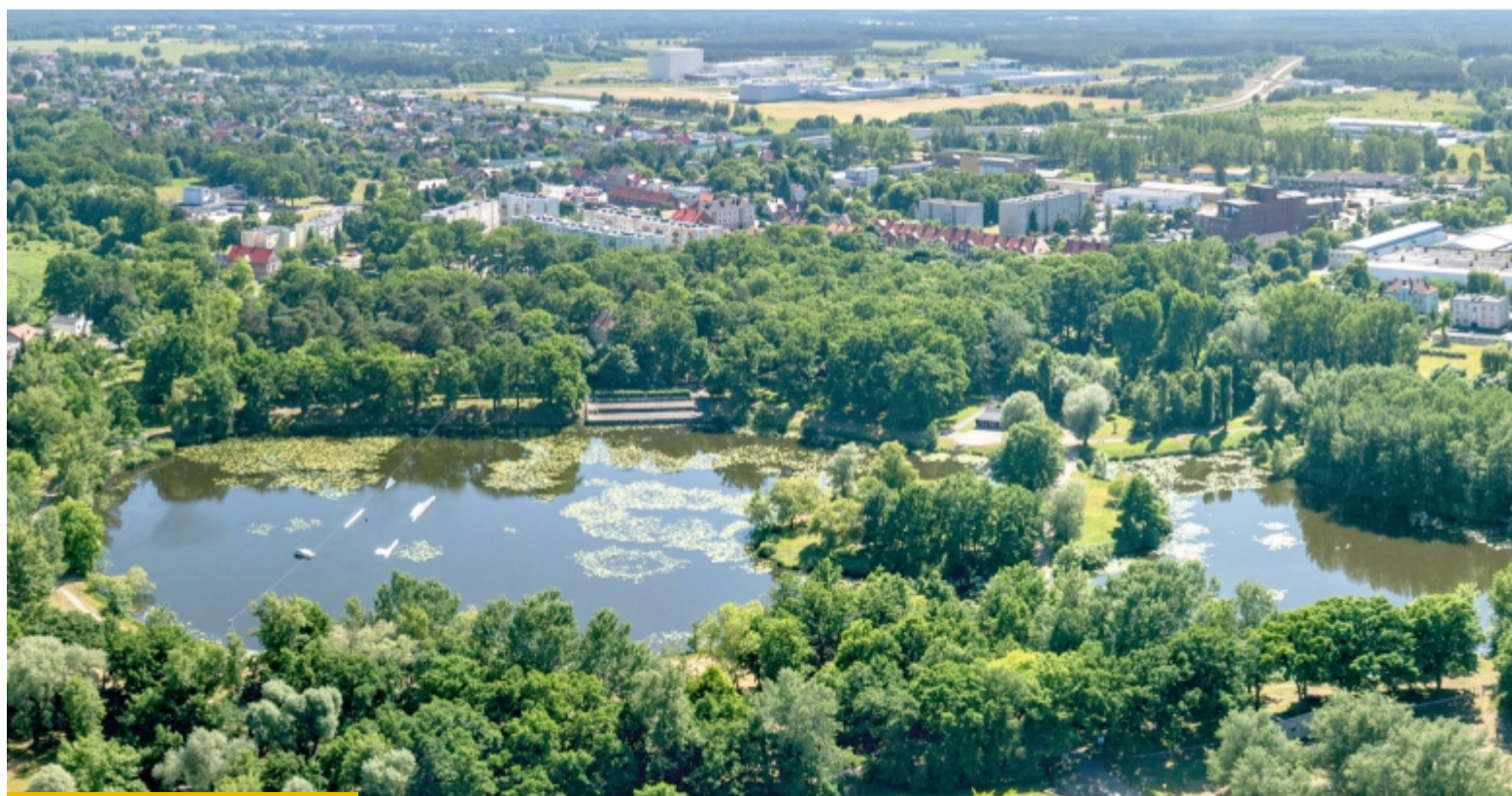
Na Kaczej Górze zamiast betonowych alejek powstaną m.in. naturalne przepuszczalne ścieżki

Najmłodsi z pewnością docenią Park Wodny Świat. Znajdzie się w nim wodny plac zabaw edukacyjnych. Powstanie strefa gastronomiczna dla food trucków, pomost z altaną, plaża, a nawet boisko do plażowej piłki i bulodrom.