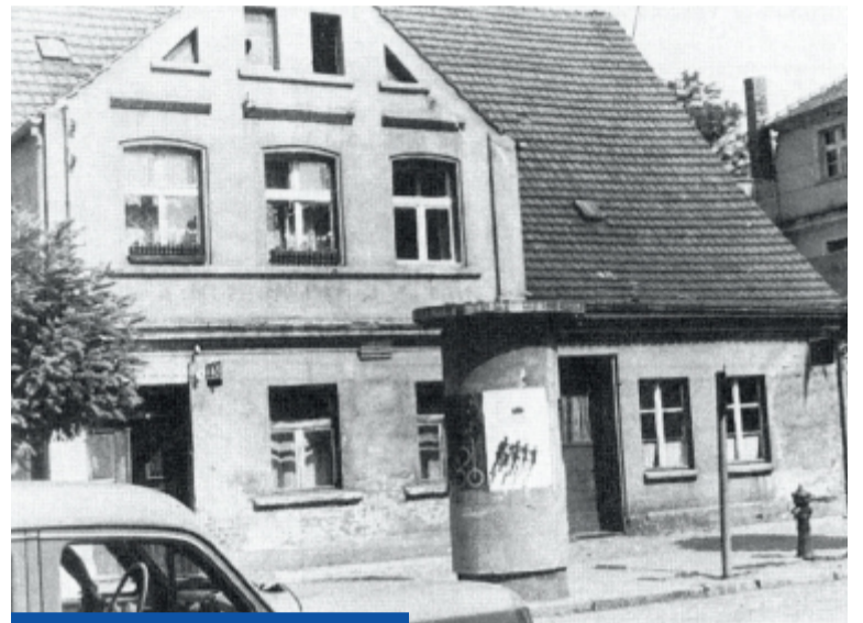
Nieistniejący już dom z duchami przy ul. Witosa