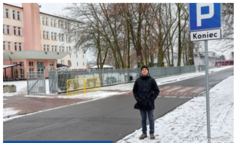
Po reakcji rodziców i radnego Ł. Hendla przed i za przejściami na ul. Gimnazjalnej zostaną wymalowane strefy wyraźnie wyłączone z możliwości zatrzymania się

Czy to oznacza, że przy ulicy Gimnazjalnej nie zaparkujemy? – Nie – uspokaja Kośmidek. – Zasada parkowania po prawej stronie (na jezdni jednokierunkowej) pozostaje, bo w tym działaniu nie chodzi o nowe zakazy, lecz o wyeks-