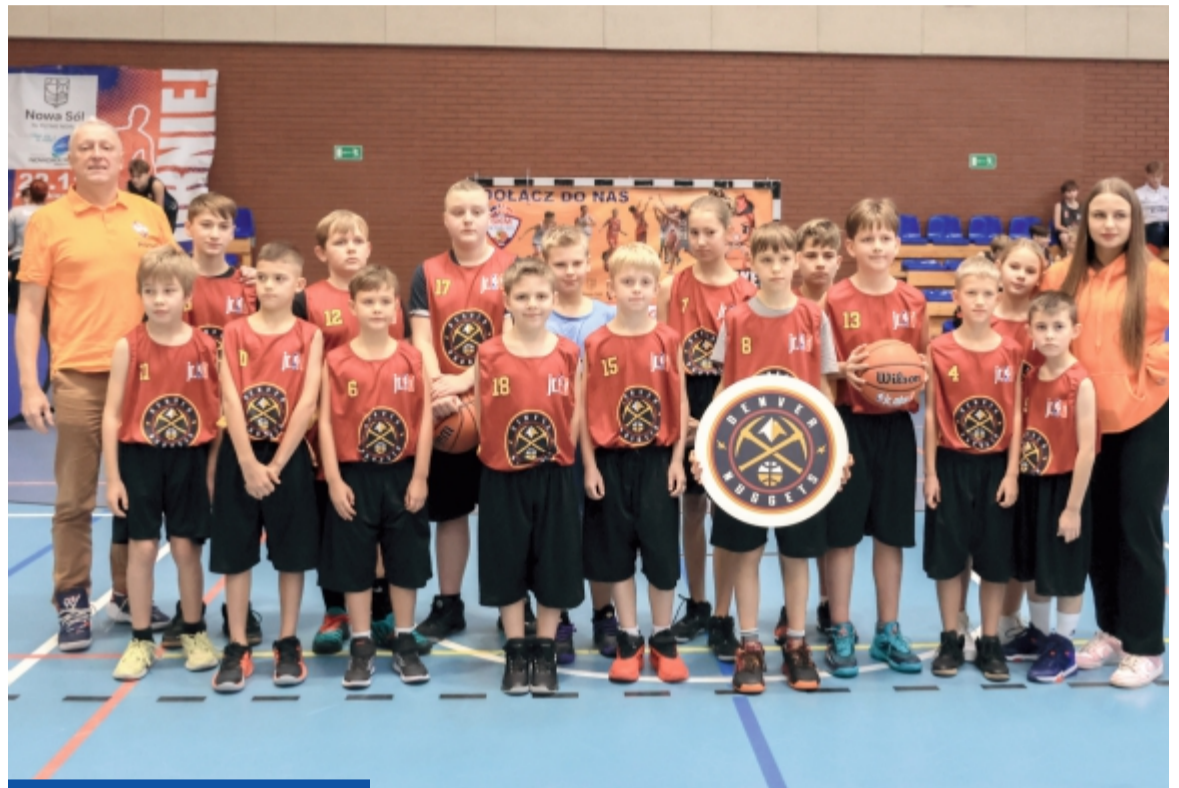
UKS Sympatycy Koszykówki Młodzieżowej na szkolenie dzieci i młodzieży otrzymają od miasta 45 tys. zł