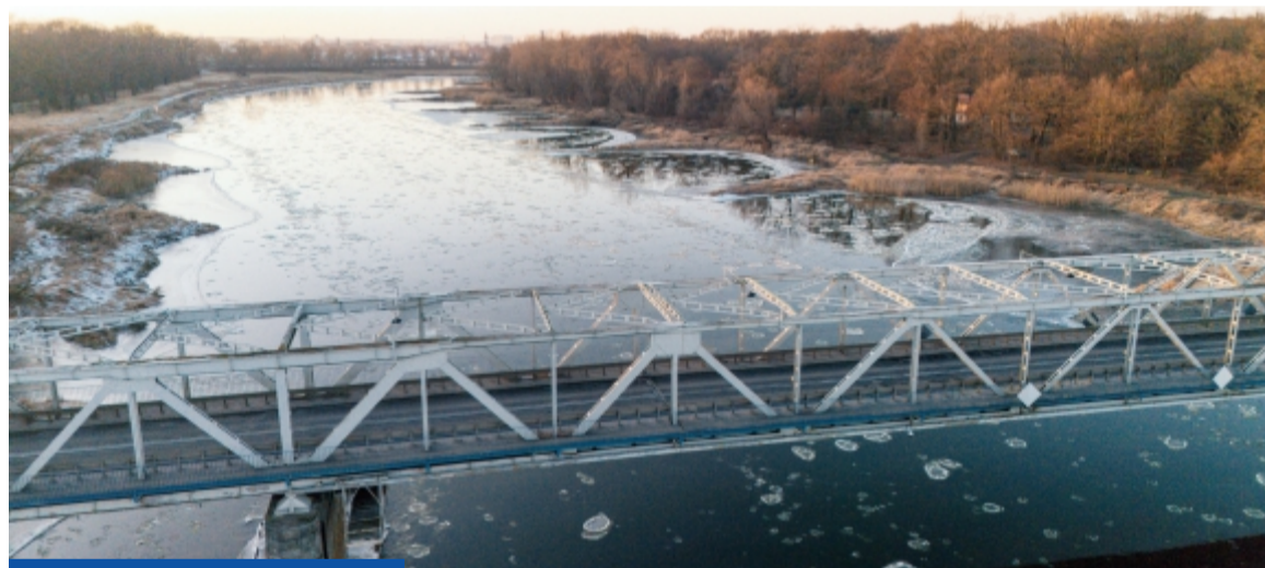
Ekspertyzy rzeczoznawców po powodzi z jesieni 2024 r. wskazały jasno - konstrukcja mostu kolejnej powodzi może już nie wytrzymać