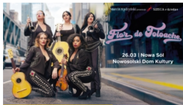
Na latynoamerykański klimat z Flor de Toloache NDK zaprasza 26 marca

Potańcówka dla kobiet – Magazyn Solny serdecznie zaprasza na wyjątkową potańcówkę dla pań w rytmach eurodance. Podczas tego wieczoru wybrzmia największe przeboje eurodance oraz klasyki lat 80. i 90., które porwą uczestniczki do wspólnej zabawy. Zachęcamy by świętować w kobiecym gronie – z mamą, babcią, siostrą, córką czy przyjaciółką. Bilety w cenie 10 zł dostępne są w Maga-