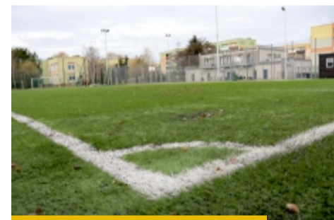
Koszty utrzymania najbardziej obleganego Orlika (ul. Jana Pawła II) wynoszą ok. 12 tys. zł. rocznie

Pojawiły się głosy, że opłaty mają charakter fiskalny, a miasto chce zarobić na Orlikach. Prosta analiza stawek pokazuje, że celem wprowadzenia opłat jest uregulowanie dostępu, a nie komercjalizacja obiektów. - Średnio roczny koszt utrzymania jednego Orlika to ok. 200 tys. zł. W tej kwocie zawarty jest koszt zatrudnienia pracowników obsługi, koszty energii, wody, nieczystości