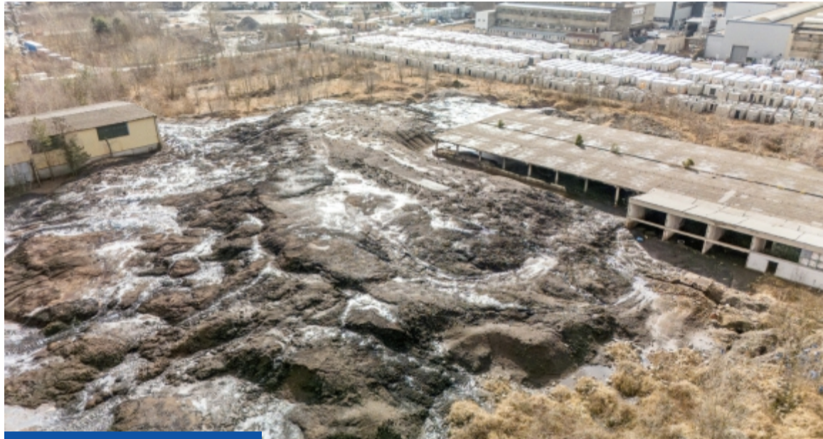
Problem hałdy niepokoi miasto już ponad 20 lat

W roku 2005 w wyniku kontroli Wojewódzkiego Inspektoratu Ochrony Środowiska zezwolenie