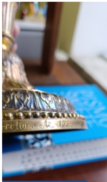
Jak na plebanię trafił kielich z 1788 roku? Będę próbował to do czerwca wyjaśnić, kiedy to spotkamy się, by zobaczyć rzeczy, których zwykły śmiertelnik normalnie by nie miał okazji zobaczyć

a do krawędzi parapetu ambony 5,70 metra. Kaznodzieja stoi 5,10 metra nad zgromadzeniem. Jak pokazuje ilustracja, ambona znajduje się bezpośrednio za ołtarzem, stojący w oddali mają wrażenie, jakby była zbudowana nad samym ołtarzem. Interesującą rzeczą w kompleksie jest to, że ta ambona nie jest pierwotna. W kościele ukończonym w 1839 r. i konsekrowanym w Niedzielę Trójcy Świętej 1839 r. – wzniesionym dzięki osobistej interwencji ówczesnego księcia koronnego, późniejszego króla Fry-