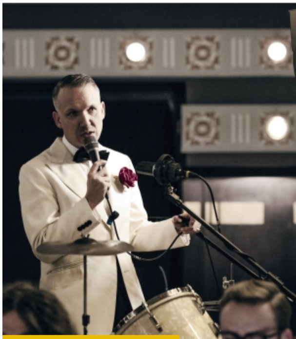
Orkiestra Jana Emila Młynarskiego zagra w Dzień Kobiet

Bilety: 80 zł normalny/60 zł dla Pań/50 zł z Nowosolską Kartą Seniora. Sala widowiskowa Nowosolskiego Domu Kultury. 8 marca (niedziela) godz. 18.00.