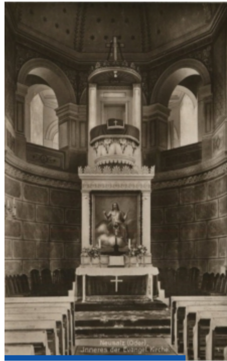
Tak prezentowała się najwyższa ambona na Śląsku

„Położona na wysokości 67 m n.p.m. Neusalz posiada najwyższą ambonę. W tym ostatnim odległość od podłogi prezbiterium do jego własnej podłogi wynosi 4,75 metra,