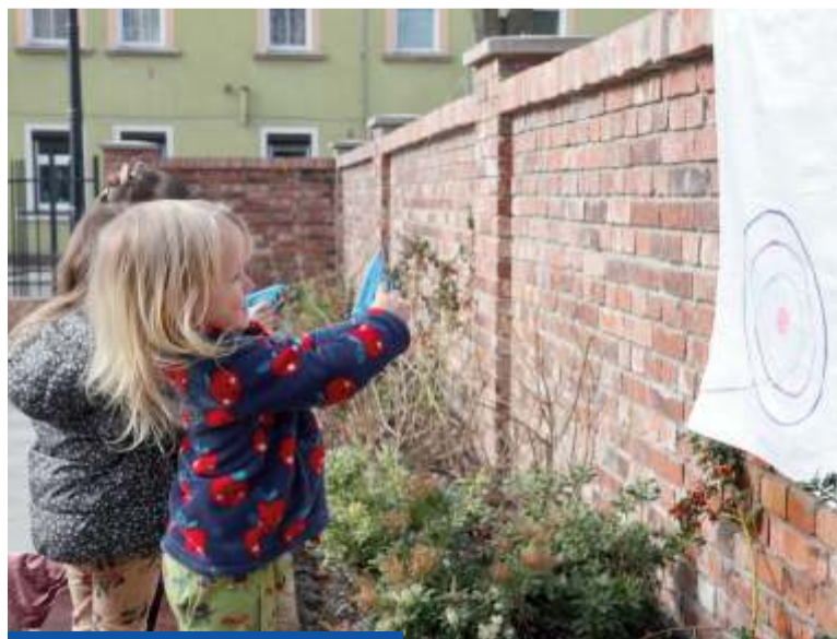
Dzieci szukały zajączka, kicały w workach i strzelały do celu z zabawek na wodę

Wzdłuż chodnika posadzono kasztanowce czerwone – ozdobne drzewa, które już w tym roku mogą zakwitnąć. Towarzyszą im rośliny niskie i zimozielone, m.in. osmantusy, kareksy oraz modrzewnice. Dobór gatunków nie jest przypadkowy, to rośliny rodzime i miododajne, które mają nie tylko cieszyć oko mieszkańców, ale też wspierać lokalny ekosystem.