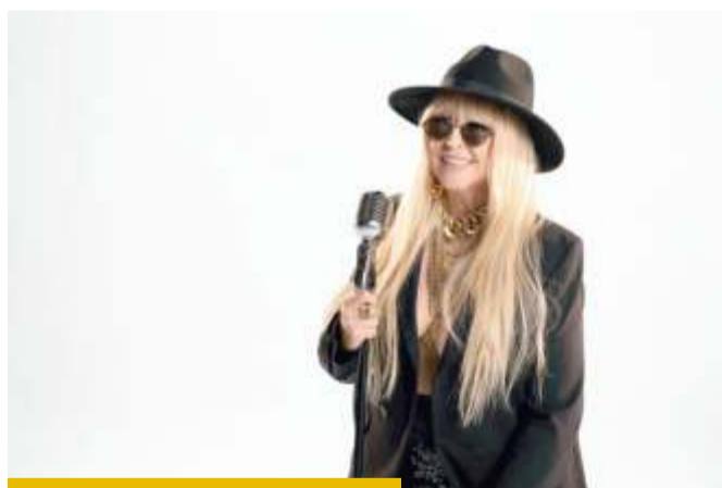
Maryla Rodowicz będzie ostatnią gwiazdą Święta Solan 2026