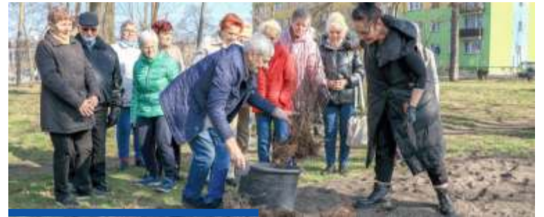
Przy zagospodarowaniu Skweru Zgody pomagali pomysłodawcy tej inicjatywy, czyli seniorzy

Alejki, skwery, miejsca w centrum i nie tylko – w połowie marca rozpoczęły się liczne, intensywne prace związane z zazielenianiem miasta przez pracowników Wydziału Gospodarki Komunalnej i Ochrony Środowiska