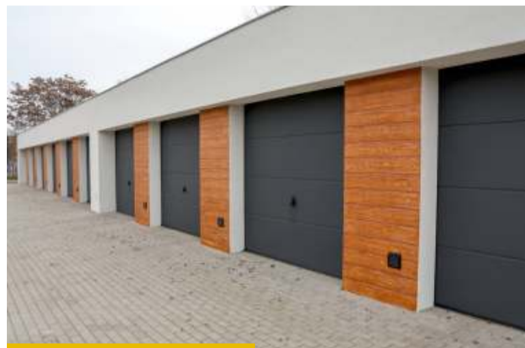
Przed wystartowaniem w przetargu garaże można obejrzeć 8 kwietnia

Zanim mieszkańcy podejmą decyzję, mogą obejrzeć garaże w wyznaczonych terminach. Pierwsze oględziny odbędą się dziś tj. 1 kwietnia. Kolejne 8 kwietnia w godz. 15.30–16.00. Warunek: wcześniejszy kontakt z urzędem i zgłoszenie chęci udziału na co najmniej jeden dzień przed usta-