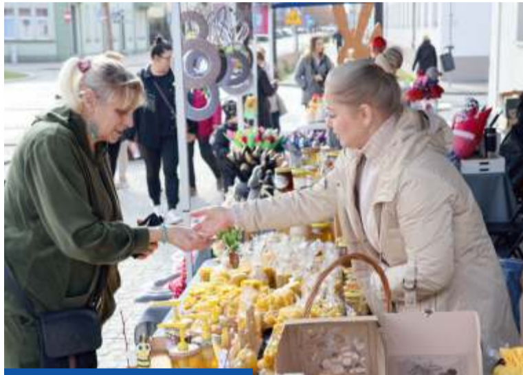
Mieszkańcy chętnie sięgali po lokalne produkty spożywcze i rękodzieło