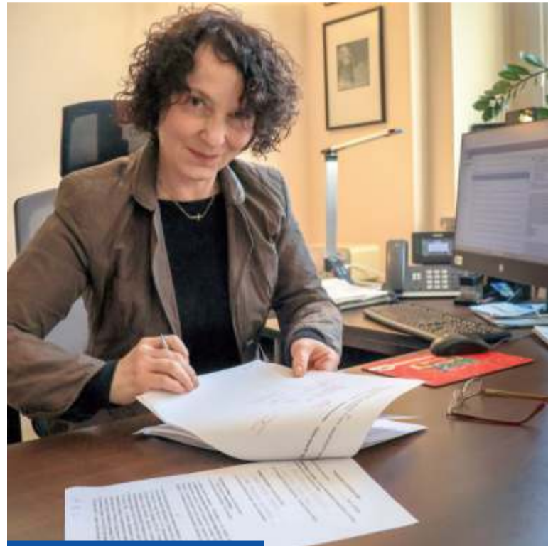
Podpis prezydent B. Kulczyckiej oznacza, że miasto wzięło na siebie 88 proc. wkładu własnego do inwestycji

– Dla mnie to był bardzo ważny podpis – podkreśla prezydent Nowej Soli Beata Kulczycka. Nowa Sól, Powiat Nowosolski oraz Województwo Lubuskie zawarli porozumienie dotyczące przygotowania i realizacji budowy nowego mostu na Odrze w ciągu drogi wojewódzkiej 315 – jednej z najważniejszych inwestycji infrastrukturalnych w regionie