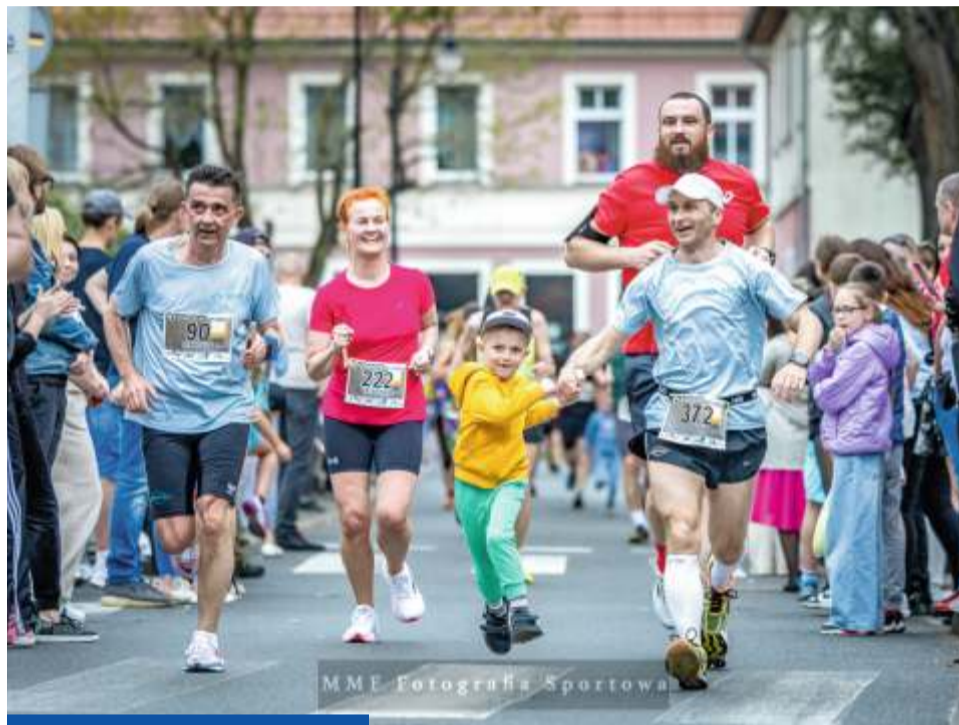
BdPG to nowosolskie święto biegania, które bawi i zawodników i kibiców