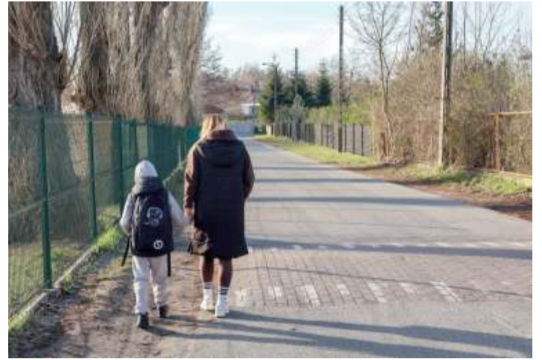
Brak chodnika przy ul. Młodych to problem nierozwiązany od wielu lat