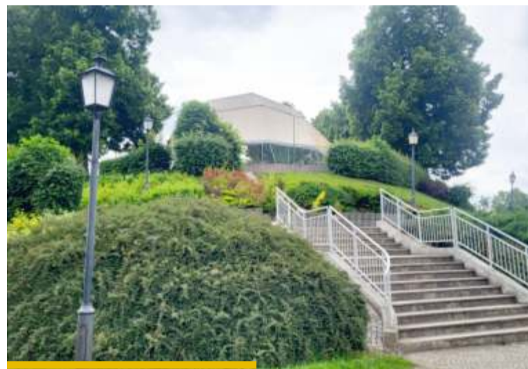
Projekt zakłada m.in. zrewitalizowanie sceny, tarasów i widowni Harcerskiej Górki

Kolejnym elementem będzie strefa relaksu wzdłuż ulicy Żwirki i Wigury. To właśnie tam powstanie tętniąca solankowa oraz drewniana alejka spacerowa z miejscami do odpoczynku. Całość dopełni „świetlna ścieżka” złożona z 96 opraw doziemnych, która po zmroku stworzy wyjątkowy klimat i podkreśli rekreacyjny charakter tego miejsca. Duże zmiany czekają także „Harcerską Górkę”. To przestrzeń, która po modernizacji odzyska swój potencjał jako miejsce spotkań i wydarzeń plenerowych. Nowa nawierzchnia sceny i tarasu, odnowiona widownia, elementy małej architektury – w tym leżanki i huśtawki – oraz