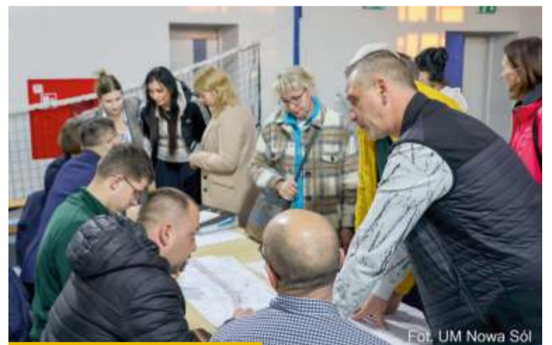
Mieszkańcy zwracali uwagę na kwestie, które bezpośrednio wpływają na ich codzienne funkcjonowanie

Harmonogram to jednak tylko część obrazu. W trakcie spotkania mieszkańcy zwracali uwagę na kwestie, które bezpośrednio wpływają na ich codzienne funkcjonowanie: oświetlenie ulicy i przejść dla pieszych, zabrudzenia na nowych chodnikach, zacieki oleju, pozostałości kruszywa czy korzenie pozostawione po wycince. Nie brakowało też pytań o organizację ruchu i dojazd do posesji. Szczeg-