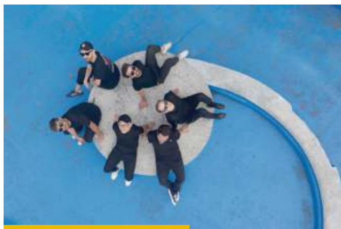
Na Happysad zapraszamy z kolei w piątkowy wieczór