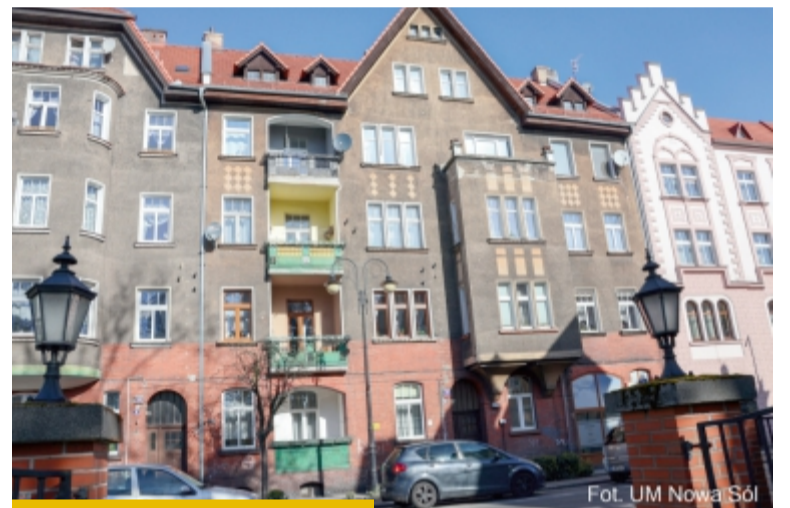
Mieszkańcy kamienicy przy ul. Zjednoczenia 16 szykują szeroką modernizację