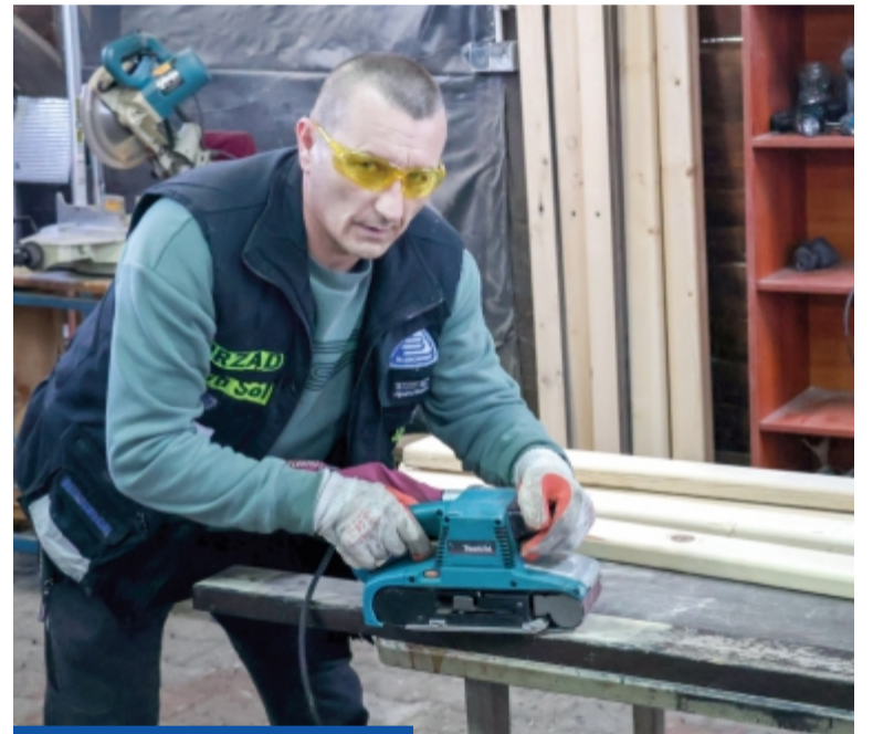
Pracownicy mają do dyspozycji piły, heblarki, szlifiarki – słowem wszystko, co potrzebne