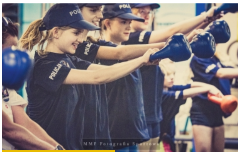
Swing to proste ćwiczenie z użyciem ciężarków kettlebell

Z kolei niebawem, bo w piątek 24 kwietnia, odbędzie się kolejna już