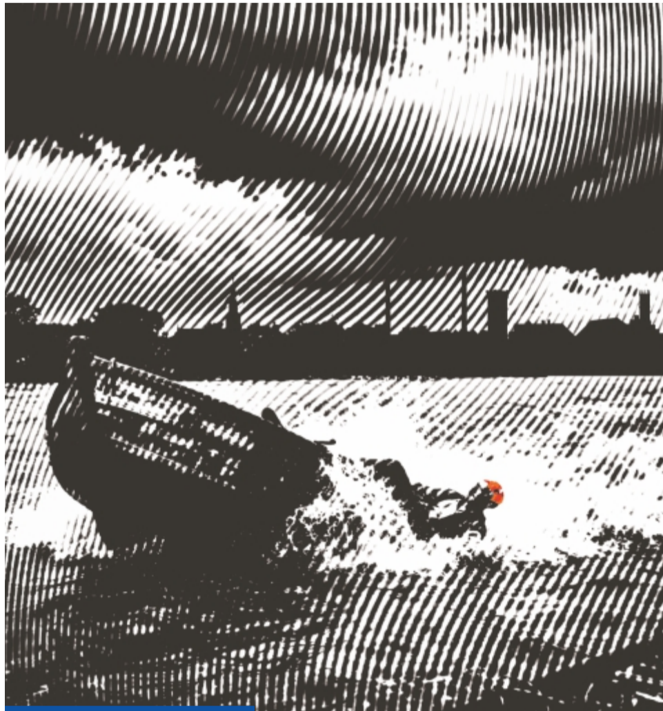
Wiele lokalnych wierzeń i przesądów związanych było z rzeką. Stąd w naszym folklorze wielu wodników, duchów topielców, bagiennych ogni i podobnych indywiduów

Przy małej dziurze wypełnionej wodą nad Odrą pod Nową Solą krąży krasnoludek, który wędrowcom w północnych godzinach wskazuje na plecy. Ciężar krasnoludka jest coraz większy, aż napadnięty zapada się w ziemi. Przestrzegano, by z krasnoludkami, przedstawicielami mocy nieczystych, nie wchodzić w żadną komitwę.