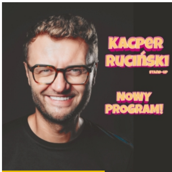
Kacper Ruciński to gwarancja salw śmiechu!

Kacper Ruciński – Stand up – Najnowszy program! Będzie śmiesznie, kontrowersyjnie, głupio i abstrakcyjnie. Oczywiście, jak zawsze też sobie trochę pogadamy. Nie bądź łos. Przyjdź! Co Ci szkodzi? Co? – zachęca Ruciński, który swoją determinacją wprowadził stand-up na polską scenę. Zdobywca niezliczonych nagród i wyróżnień, scenarzysta, aktor, improwizator, prezenter telewizyjny, ale