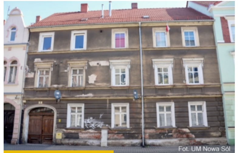
Podobnie jest przy Grota-Roweckiego 8, gdzie zmiany zajdą i od frontu, i od podwórka