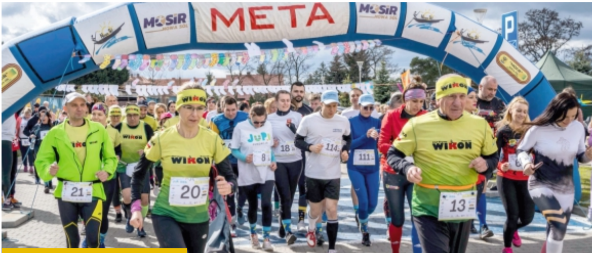
Bieg JuPi zaczyna i kończy się przy Centrum Aktywności Społecznej (ul. Kasprowicza 12)

Już w sobotę (18.04) odbędzie się czwarta edycja charytatywnego biegu Fundacji JuPi, który jest nie tylko aktywnością sportową, ale też manifestem akceptacji, zrozumienia i solidarności z osobami z zespołem Downa oraz wszystkimi osobami z niepełnosprawnościami