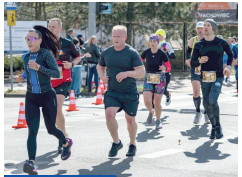
Organizatorzy i kibice jak zawsze zadbali o to, żeby biegacze świetnie wspominali te zawody