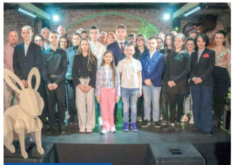
Najzdolniejsi, najbardziej pracowici w sporcie i kulturze młodzi nowosolanie