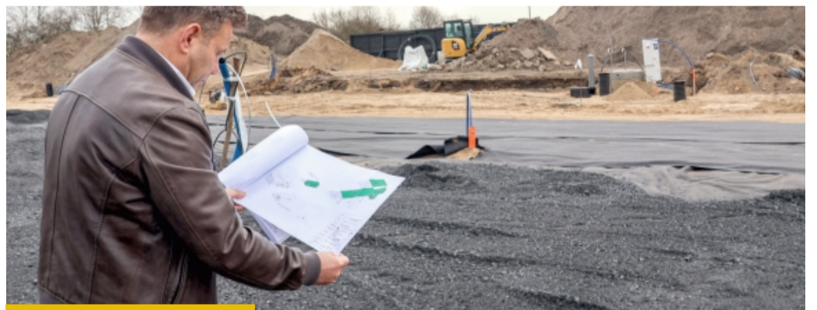
Nowy PSZOK będzie większy, uporządkowany i pełny nowych możliwości

wicie odmienić to miejsce. Najbardziej odczuwalna zmiana? Nawierzchnia. Betonowa, równa, trwała. – Będzie gładko, bez błota i problemów z wyjazdem. Cały plac zostanie solidnie utwardzony – zapowiada Petreczko. To właśnie komfort użytkowników jest jednym z głównych założeń projektu. Nowy PSZOK ma być miejscem intuicyjnym i uporządkowanym. Samochody będą wjeżdżać na wagę, która automatycznie określi ciężar odpadów. Dalej ruch poprowadzi jasno wyznaczona trasa. Zmieni się też skala. Obiekt będzie niemal dwa razy większy niż obecny. Pojawi się zaplecze socjalno-biurowe, magazyn z warsztatem oraz wiata na kontenery. Całość zostanie ogrodzona, oświetlona i objęta monitoringiem. Ale to nie tylko inwestycja w infra-