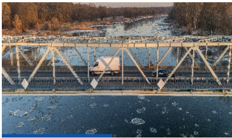
Budowa nowego mostu ma zakończyć się w październiku 2029 roku