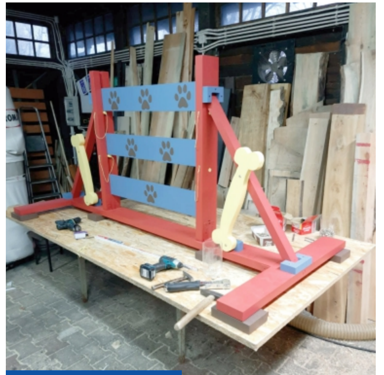
W stolarni powstają ciekawe elementy małej architektury widoczne w całym mieście