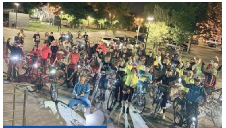
Rowerowy czerwiec zapowiada się kosmicznie!

– W nawiązaniu do odległości Ziemi od księżyca (384 tys. km) ustaliliśmy tygodniowe minimalne liczby kilometrów do pokonania, za które będziemy wręczać określone przypinki. Cel dla młuszków to 3,8 km, dla nieco starszych 38 km, a dla ambitniejszych