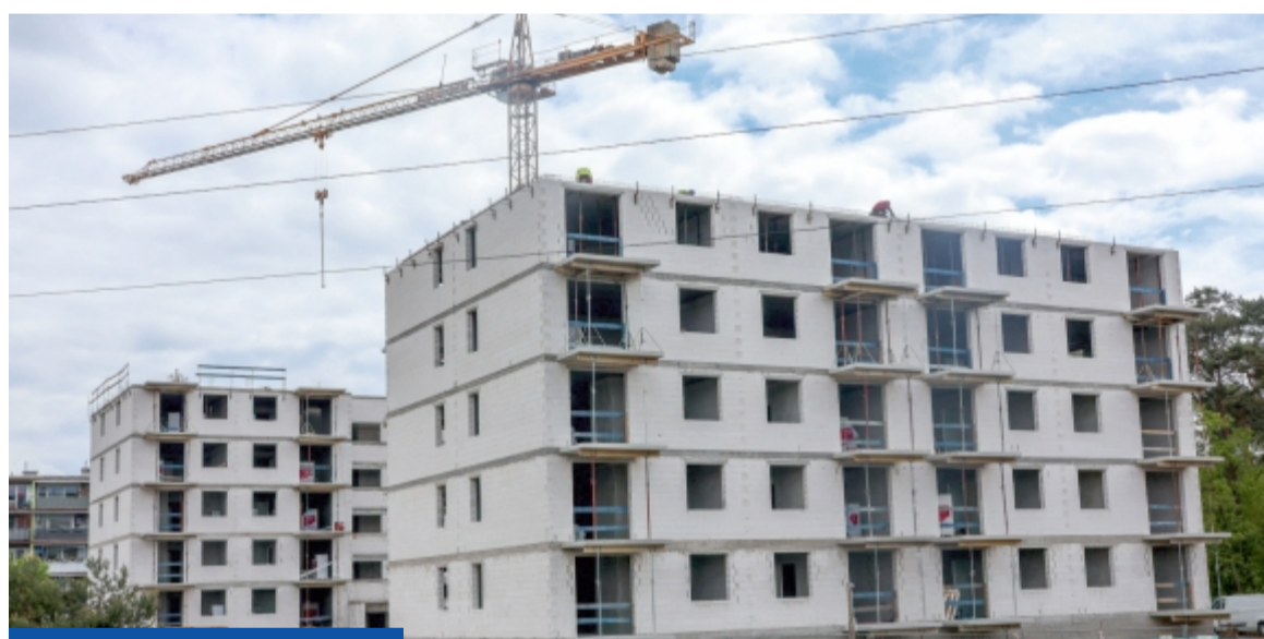
Wnioski o mieszkania SIM będą oceniane w oparciu o ustalone kryteria