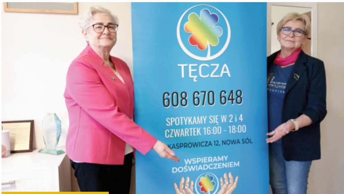
Szefowe Nowosolskich Amazonek zapraszają na profilaktyczną akcję (26 maja o godz. 13.00) i do swojej siedziby w Centrum Aktywności Społecznej

Amazonki uczą profilaktyki, czyli po prostu dbania o siebie, robienia np. raz w roku dopasowanych do wieku i płci badań. Propagują refundowane przez NFZ szczepienia