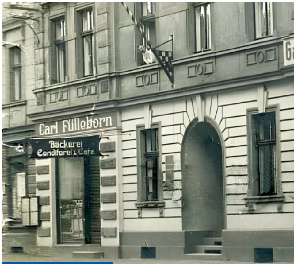
Przed wojną w dzisiejszej siedzibie Fundacji „Ze sztuką na tak” mieściła się piekarnia, cukiernia i kawiarnia

Czasem zdarza się, że ktoś, kto kupuje mieszkanie w przedwojennej kamienicy, odzywa się do mnie, żeby pomóc mu coś o tym budynku znaleźć. Lubię takich ludzi, chcą wiedzieć, kto kiedyś przez ich okno patrzył na ulicę, jak się nazywał, czym się zajmował, jak się jego los potoczył. Nadaje się temu miejscu jakąś kształtną przeszłość, zarys, układa się w tym nowym gnieździe stare patyczki od nowa. I zawsze staram się pomóc. Z taką prośbą zwróciła