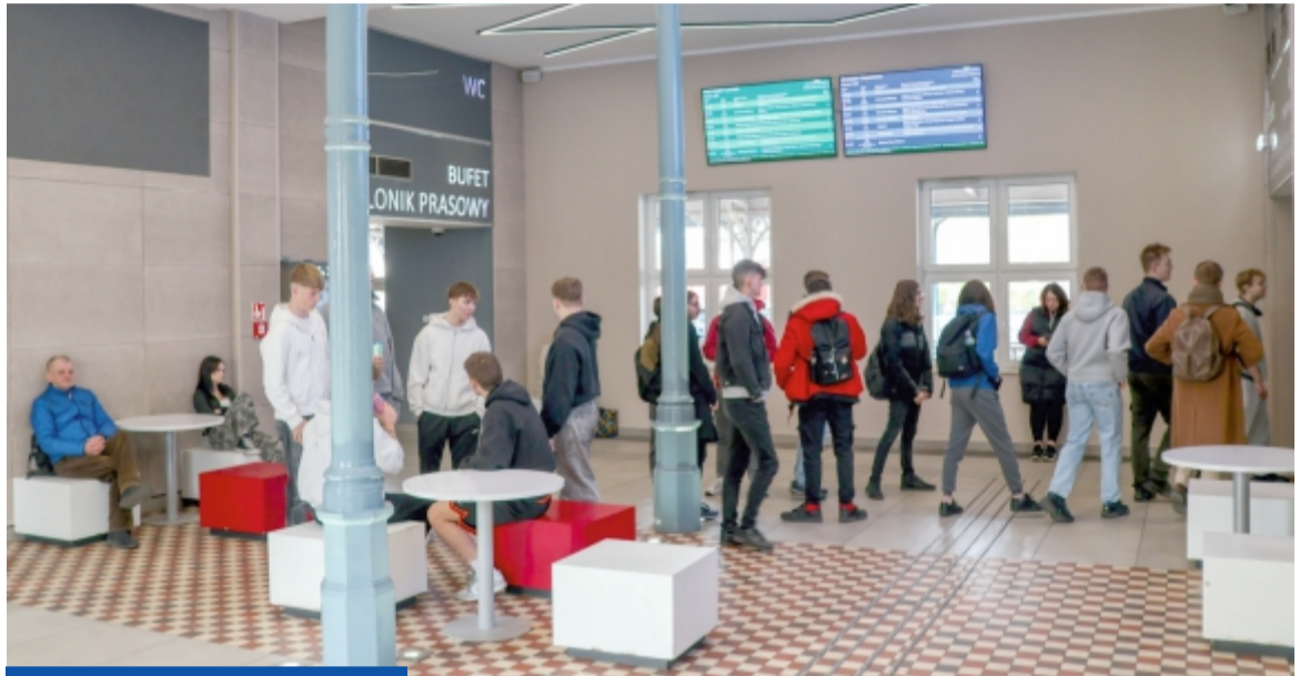
Ekran informacyjny pasażerskiej zawieszony w poczekalni dworca

Miasto planuje również ożywienie przestrzeni dworca. W przyszłości ma tu powstać kawiarnia lub cukiernia.