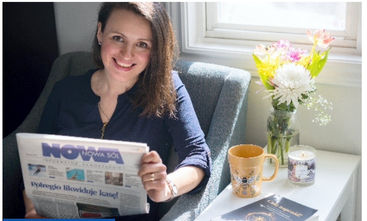
Jak widać, „NOWA” dotarła również do Kanady. A książka P. Hyrsz dostępna jest online na platformie Amazon

- To nie jest klasyczny poradnik. To połączenie osobistej historii, zmiany sposobu myślenia i bardzo konkretnego 30-dniowego programu. Każdy dzień zawiera te-