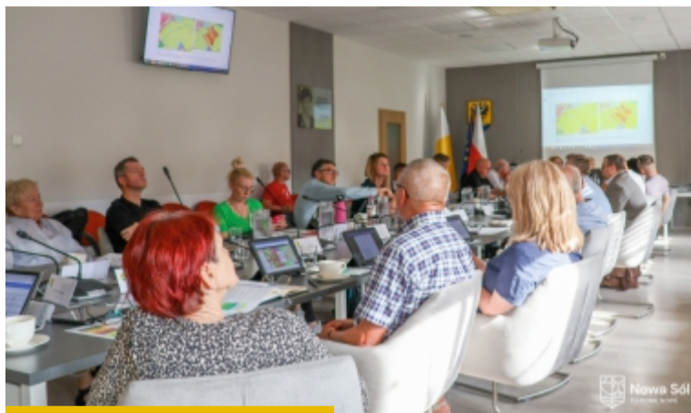
Radni przyjęli uchwałę o planie ogólnym jednomyślnie

A dzięki temu miasto będzie mogło odzyskać znaczną część środków wydanych na jego opracowanie. Przygotowanie dokumentu kosztowało ponad 220 tys. zł, a odzyskać z KPO będzie można blisko 190 tys. zł.