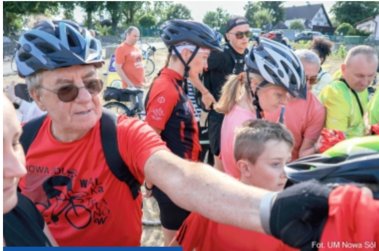
Nowosolanie co roku w czerwcu udowadniają, że kochają jazdę rowerem

- Ktoś przejedzie 38 km, inny 384, a jeszcze inny wielokrotność tej sumy. Każdy ma swój próg, swój mały rekord, swój pretekst do tego, żeby kręcić na rowerze, same-mu czy w zespole, ale na koniec we wspólnej sprawie. Dla idei, dla