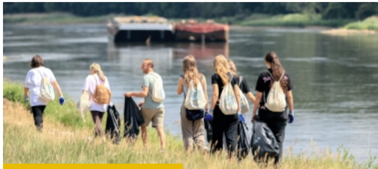
Najpierw było sprzątanie, a potem masa atrakcji na cyplu nad Odrą

- Fajnie by było przedpołudnie spędzić np. na kawie w domu u rodziców, ale dzisiaj przyszedliśmy tutaj tak naprawdę zrobić robotę za kogoś. Ktoś z niedbalstwa, braku szacunku i świadomości to miej-