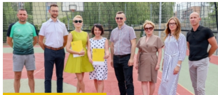
W trakcie remontu boiska poliuretanowego plac do piłki nożnej pozostanie dostępny

Jedno z najchętniej odwiedzanych miejsc sportowej rekreacji w Nowej Soli wkrótce zmieni swoje oblicze. 2 czerwca na Orliku przy ul. Jana Pawła II podpisano umowę na remont boiska do koszykówki i siatkówki. Inwestycję zrealizuje firma MIZAR Sp. z o.o.