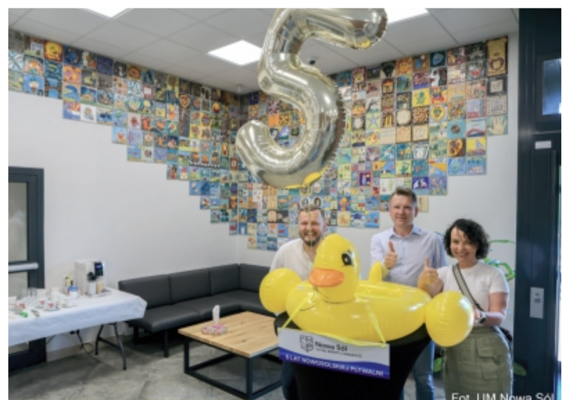
Nowosolski basen cieszy nie tylko mieszkańców miasta już od pięciu lat