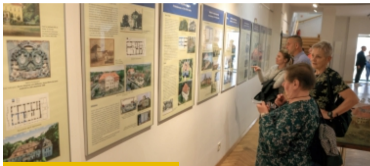
Wystawa dotycząca baroku jest pierwszą z dwóch tegorocznych o tej tematyce

- Niestety, zniszczeniu uległa największa barokowa budowla, czyli