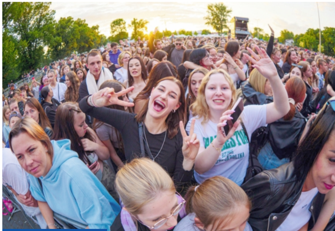
Zapowiada się weekend totalnej muzycznej (i nie tylko) zabawy! Więcej na str. 4-5

Piątkowe świętowanie rozpocznie się od wydarzeń rodzinnych (więcej str. 4 i 5), a wieczorem scena należeć będzie do gwiazd młodego pokolenia oraz jednego z najbardziej rozpoznawalnych zespołów rockowych w Polsce. Jako pierwsze wystąpią Modelki – girlband, który w ostatnich latach zdobył ogromną popularność dzięki przebojowym utworom i energetycznym koncertom. Ich muzyka łączy nowoczesny pop z elementami rapu i klubowych brzmień, a koncerty przyciągają tysiące młodych fanów. Następnie publiczność rozgrzeje Kubańczyk. Raper, influencer i uczestnik gal